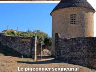
Le pigeonnier seigneurial