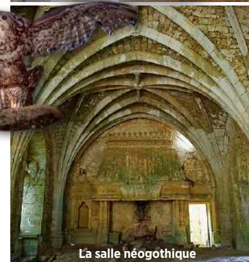
La salle néogothique