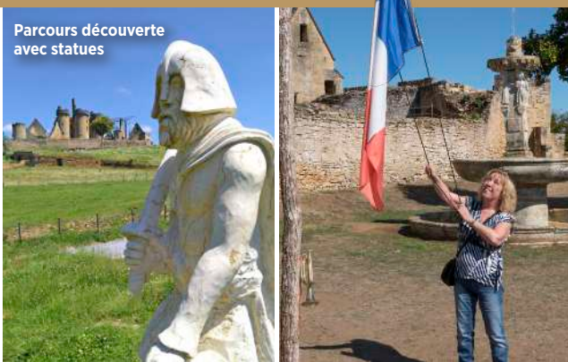
Parcours découverte avec statues

Pour continuer à aider le Château Le Paluel, régalez vos papilles dans notre ferme