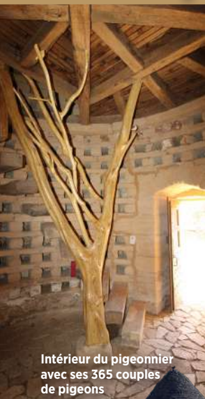
Intérieur du pigeonnier avec ses 365 couples de pigeons

Empruntez tel un chevalier le souterrain de fuite échappatoire !