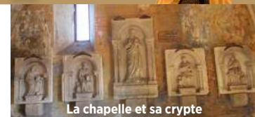
La chapelle et sa crypte