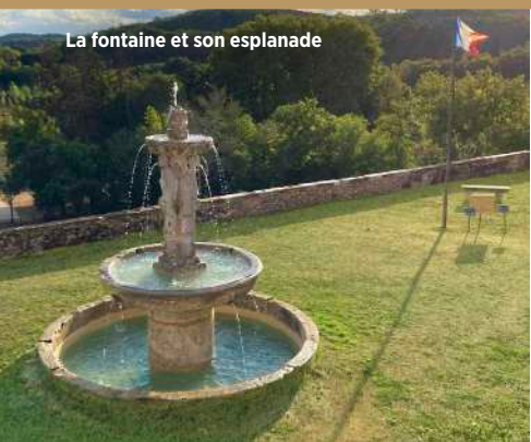
La fontaine et son esplanade